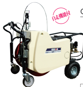
GSFL204-M 4サイクルエンジン

トラックへの乗せ降ろしが楽な自走タイプ レバーを引くとホースを巻取します。(自動整列)