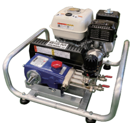
GS304E-H 4サイクルエンジン