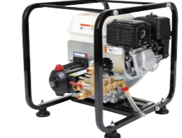
TSW41H 4サイクルエンジン

洗浄&農用防除兼用タイプ。洗浄ガン付き。 30L/分の水量でトラクター等の汚れを落とします。