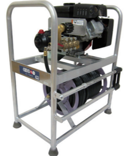
GS17EMSR 4サイクルエンジン