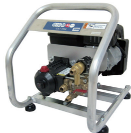
GS17EM 4サイクルエンジン