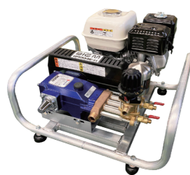
GS204E-H 4サイクルエンジン