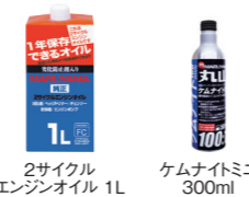
2サイクルエンジンオイル 1L ケムナイトミニ 300ml

購入時にはエンジン・ポンプにはオイルが入っておりません。必ず給油してからお使いください。