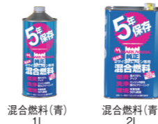
混合燃料(青) 1L 混合燃料(青) 2L