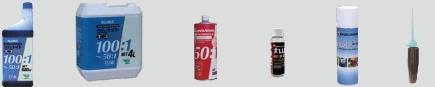
ケムナイトエコ 100 DX-1