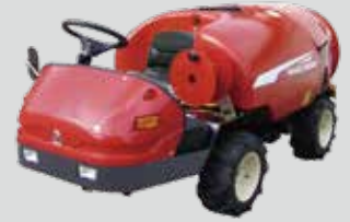
カラスプレー SS 用 (赤) カラスプレー (フレーム用グレー)