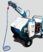
カラスプレー MSA 用 (モスグリーン)