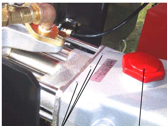
②噴霧用ポンプ シリンダ 元金具 ①噴霧用ポンプ クランクケース