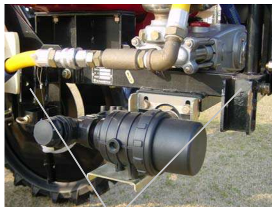
⑥スタント 抜き差し部 (左右)