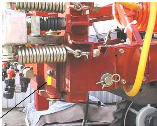
④サイドブーム支点部 (左右)