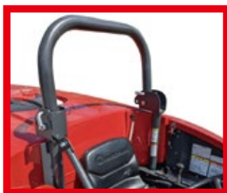
防護フレーム折畳み時

防護フレームは、転倒時にスプレーヤと地面の間に空間をつくることで、オペレータを保護します。 防護フレームは、散布時に枝や果実などの障害になる場合を除き、常に立てて正しくシートベルトを着用した 状態でご使用ください。防護フレーム 3点セットは防護フレーム、シートベルト、ヘルメットのセットです。